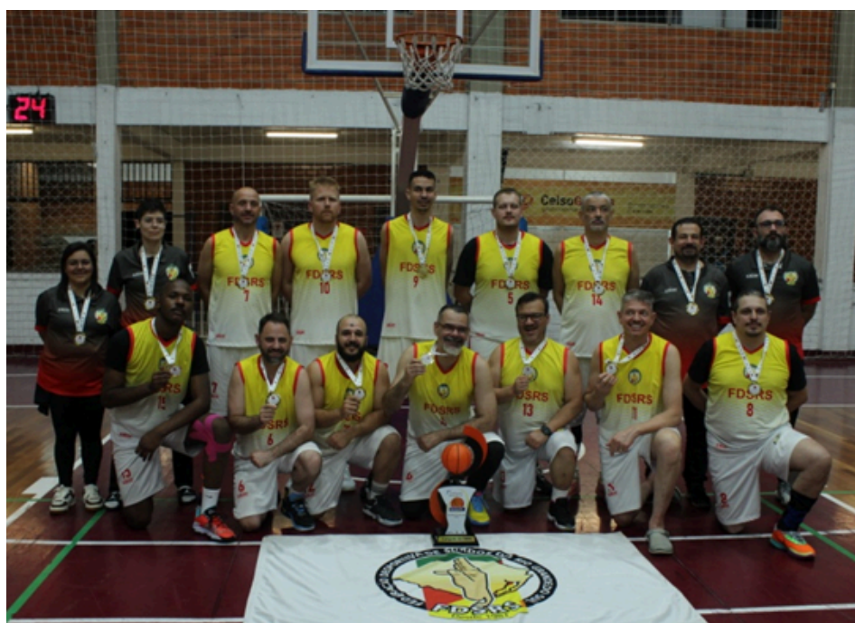
CAMPEÃO: FEDERAÇÃO DESPORTIVA DE SURDOS DO RIO GRANDE DO SUL