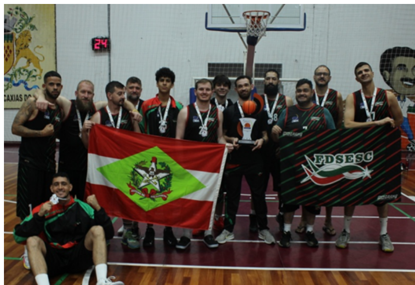
VICE-CAMPEÃO: FEDERAÇÃO DESPORTIVA DE SURDOS DO ESTADO SANTA CATARINA