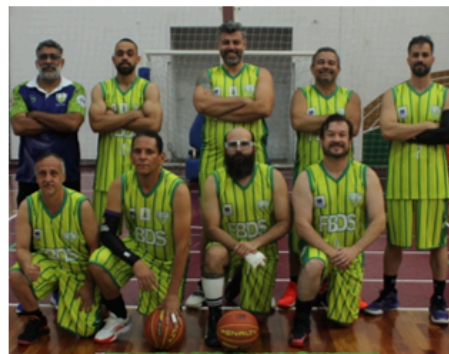
FBDS - DF