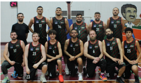
FDESSEC - SC