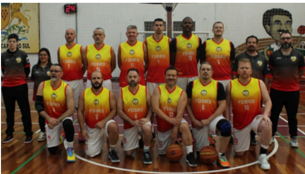
FDSRS - RS