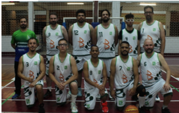
FDSP - PR