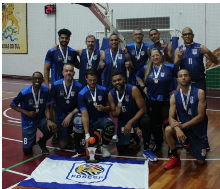
3º LUGAR: FEDERAÇÃO DESPORTIVA DE SURDOS DO ESTADO DE SÃO PAULO