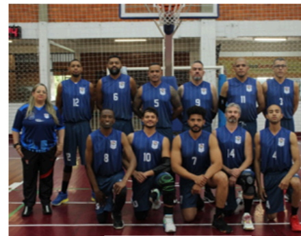
FDSESP - SP