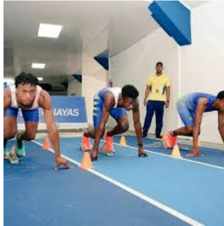
Pista de calentamiento interna