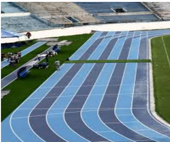
Pista atlética de 8 carriles