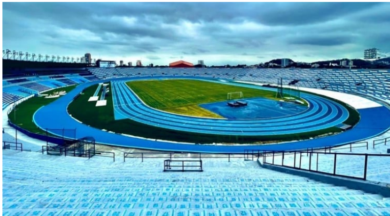
Pista atlética del estadio Modelo Alberto Spencer