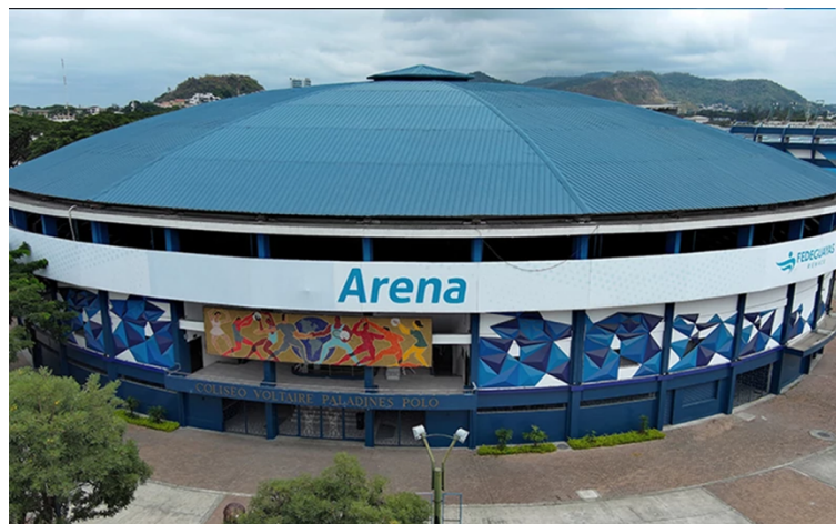
Coliseo Voltaire Paladines Polo