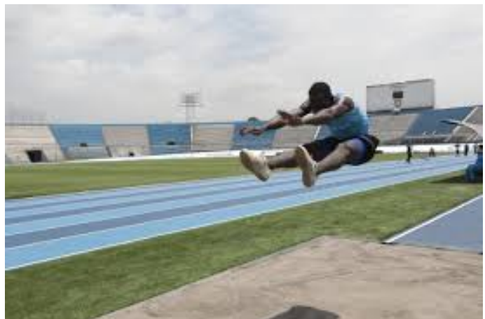
Zona de saltos