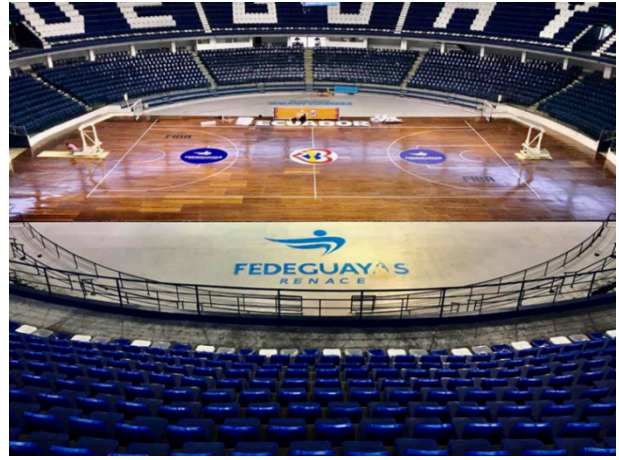
Instalaciones por dentro