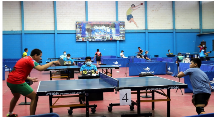
Instalaciones por dentro de Coliseo Tenis Mesa