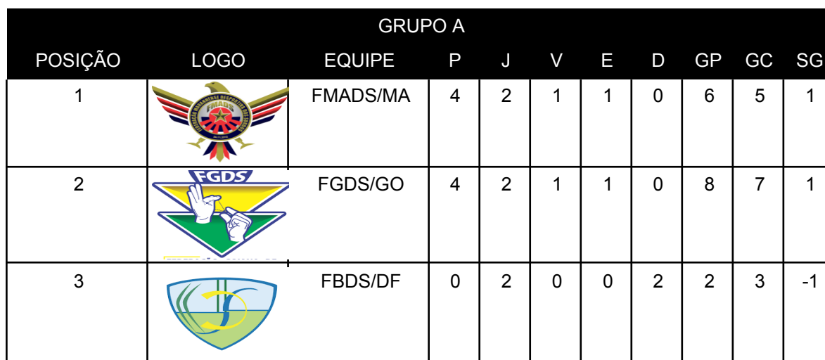
TABELA DE PONTUAÇÃO E CLASSIFICAÇÃO GERAL