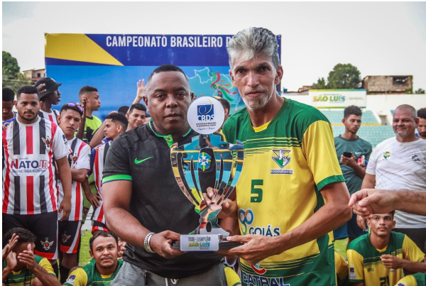
VICE-CAMPEÃO - FGDS/GO