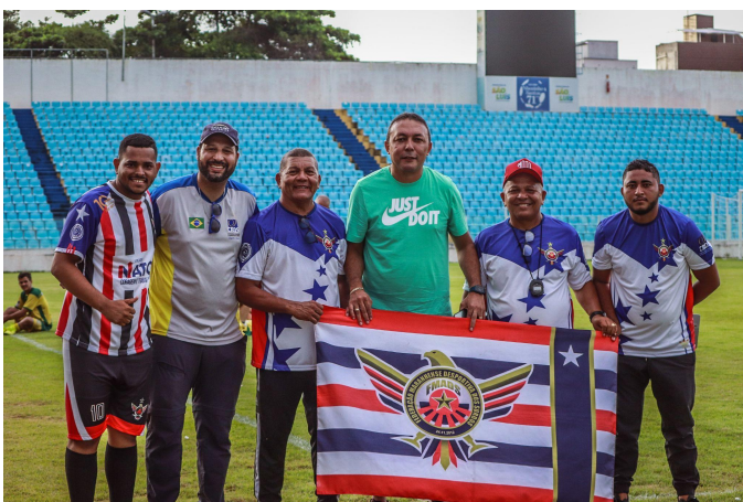
COMISSÃO ORGANIZADORA DA FMADS/MA E SUPERVISÃO DA CBDS