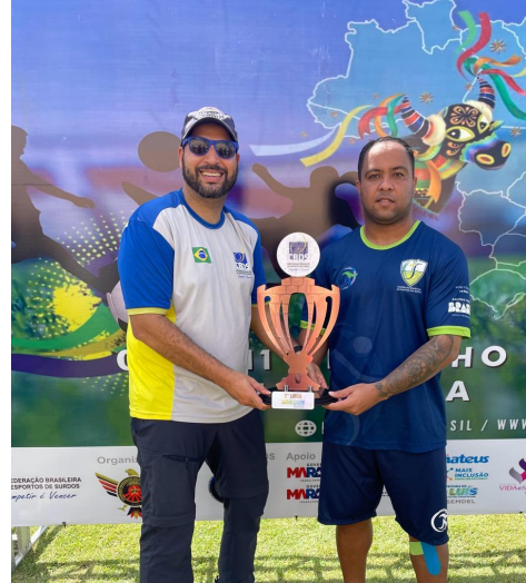
TERCEIRO LUGAR - FBDS/DF