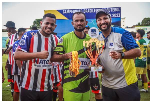
CAMPEÃO - FMADS/MA